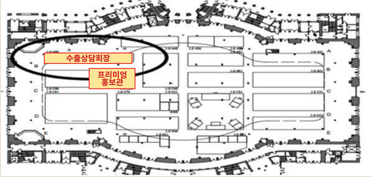
< 전시장 2홀 평면도 >