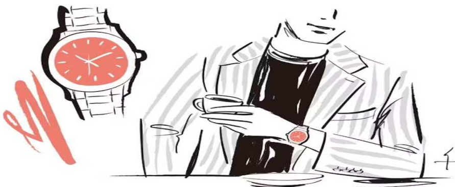
No 3, 새먼 핑크 이미지