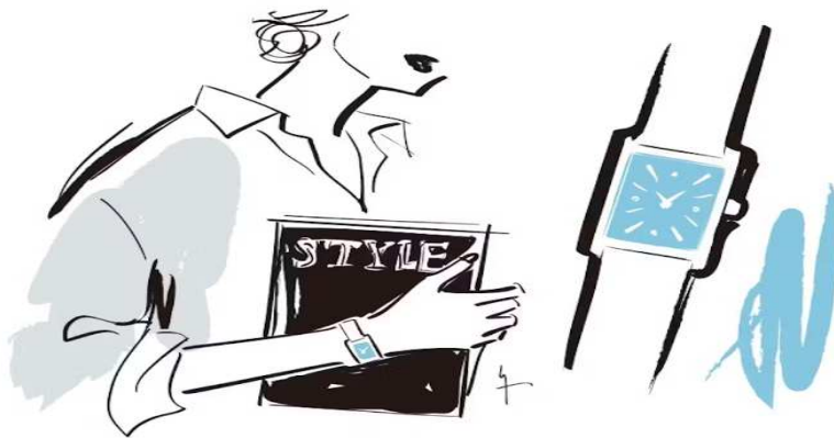
No 2, 스카이 블루 이미지