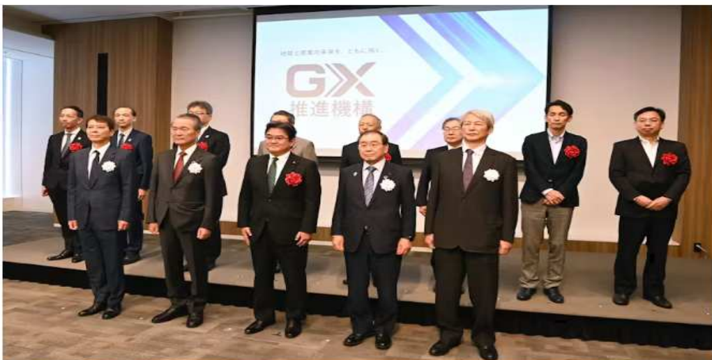
GX 추진기구(일본 도쿄도 지요다구) 개회식에서 촬영한 사진 자료